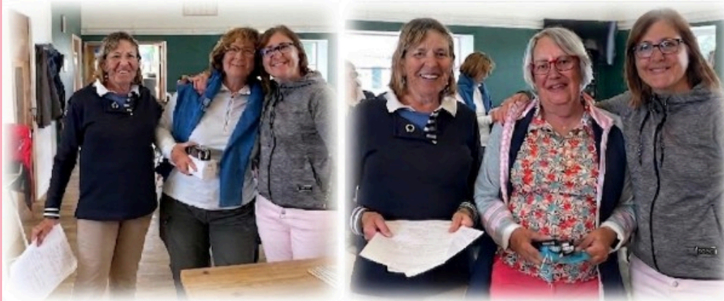
souvenirs du 18 mai 2026