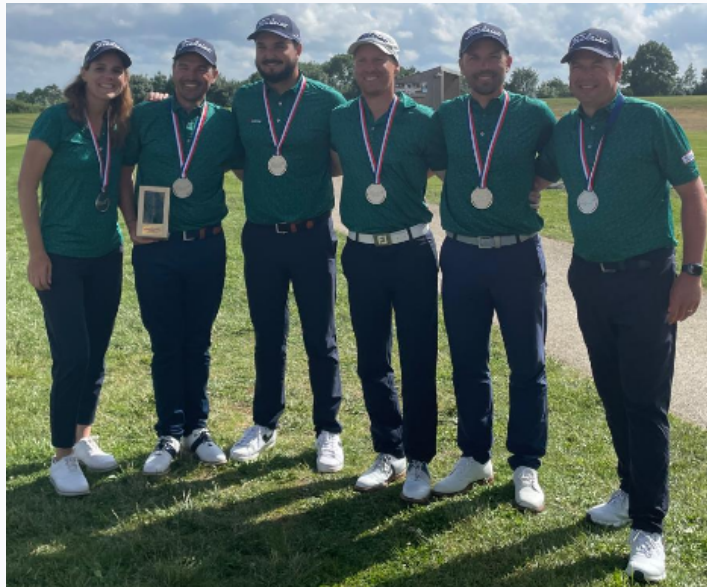
L'équipe ACUSHNET remporte le championnat

Bravo à ces équipes et à tous les joueurs. Certains ont "souffert", d'autres ont signé de jolies performances : meilleur score de 75.