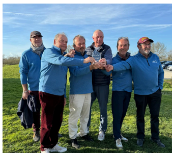
L'équipe Seniors 2 lors de sa montée en 2ème division en 2024

L'enjeu est de taille, et nos joueurs sont "fin prêts" après des séances d'entraînement intensif tout l'hiver.