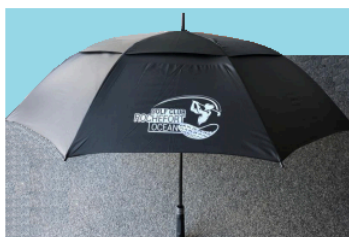
Cadeau Prestige 20 Un porte-carte de score + Un parapluie logoté

Consultez la liste des membres prestige 2024