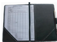
Cadeau Prestige 10 Un porte-carte de score avec puce logotée