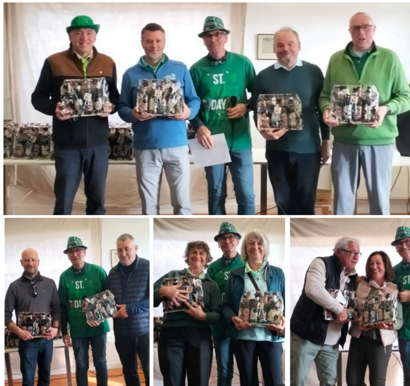
Ci-dessus quelques-unes des équipes récompensées pour les résultats du scramble

Retrouvez tous les récompensés dans la galerie de photos du jour ainsi que les résultats du scramble.